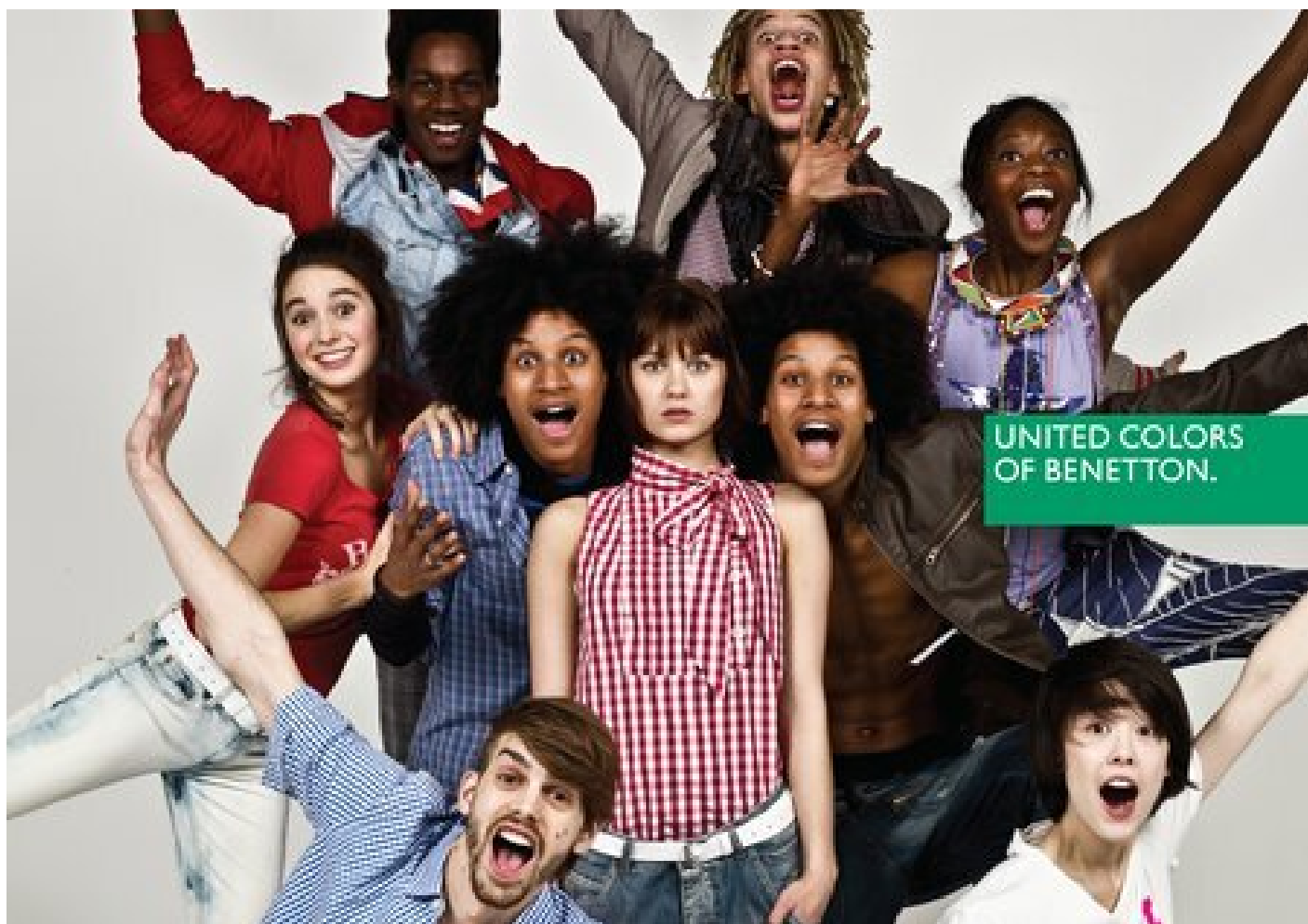
United Colors of Benetton.

A partire dal '68, il Nobody che chiede di diventare Everybody inizia a incarnarsi in figure particolari (i diversi, i marginali), e ispira nuovi formati artistici. Le trasformazioni della democrazia degli anni Ottanta e Novanta hanno portato Pierre Rosanvallon a identificare una “politicizzazione negativa” (vedi Controdemocrazia. La politica nell'era della sfiducia , Castelveccchi, Roma, 2015). Nascono i nuovi movimenti degli anni Duemila (Occupy Wall Street e Indignados, ma anche il MoVimento 5 Stelle), caratterizzati da una partecipazione attiva, da un rifiuto che si esprime con manifestazioni e slogan, da nuove forme di socializzazione attraverso comunità partecipate e creatività socializzata.