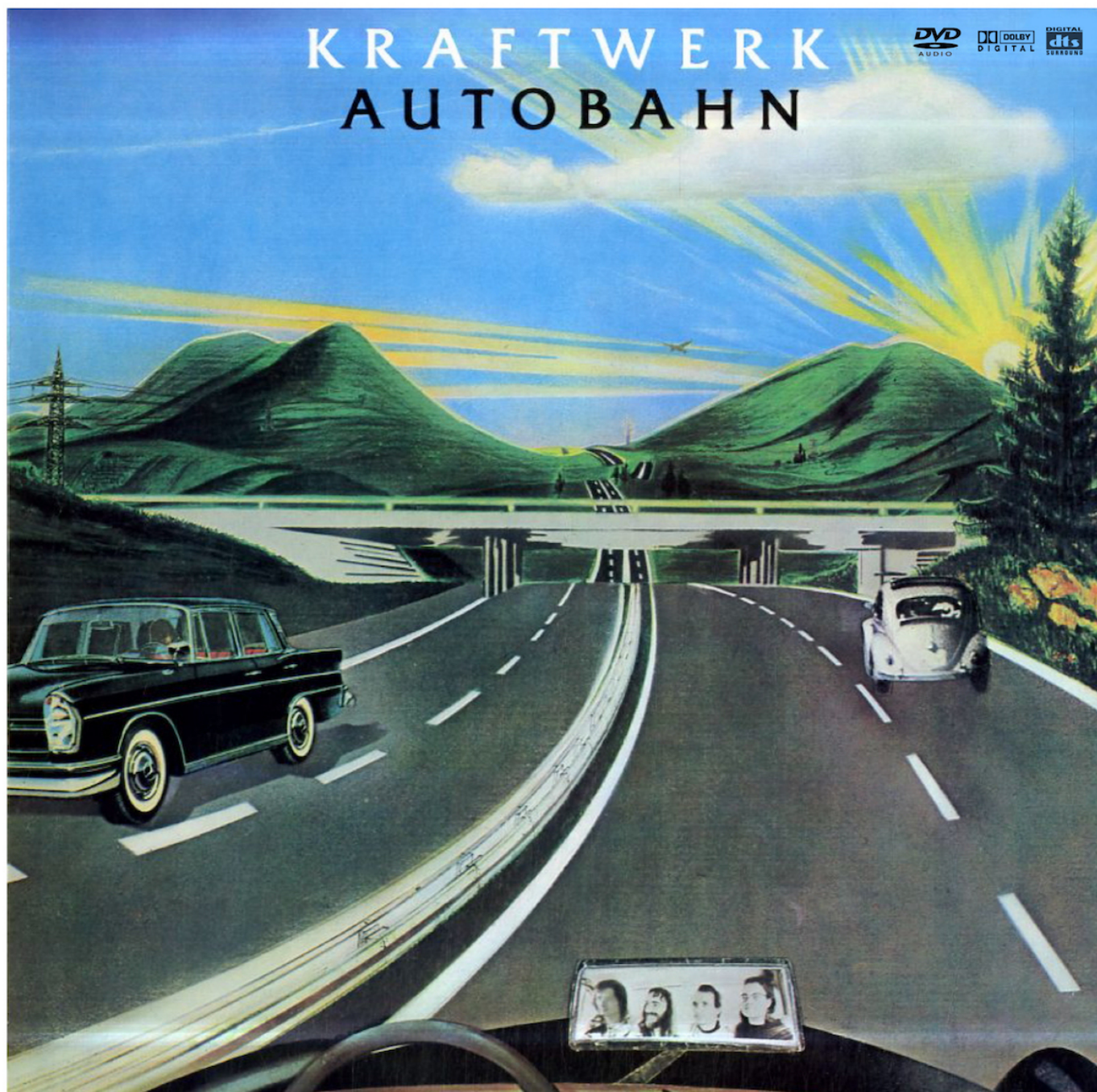
Kraftwerk, Autobahn (1974).