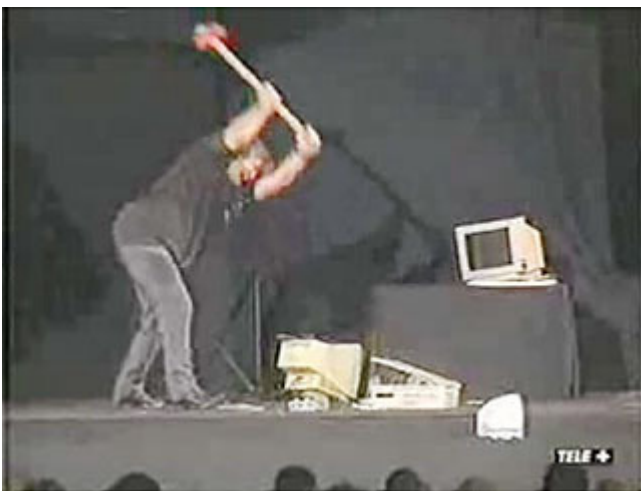
Beppe Grillo, Tutto il Grillo che conta, 2000.

Con il successo del sito beppegrillo.it nel 2005, l'Uomo Qualunque sulla scena (lo showman Beppe Grillo) ha incontrato l'Uomo Comune 2.0 (i milioni di visitatori del sito). Attraverso gruppi di discussione come i Meet Up e forme di consultazione spesso elementari – le “parlamentarie” online per scegliere i candidati, le primarie con i video da votare sempre online sul modello dei talent show, la piattaforma Rousseau lanciata nel 2016 – il MoVimento 5 Stelle ha sperimentato varie procedure per condensare i desideri dei singoli in una volontà comune, da esprimere in una deliberazione condivisa.