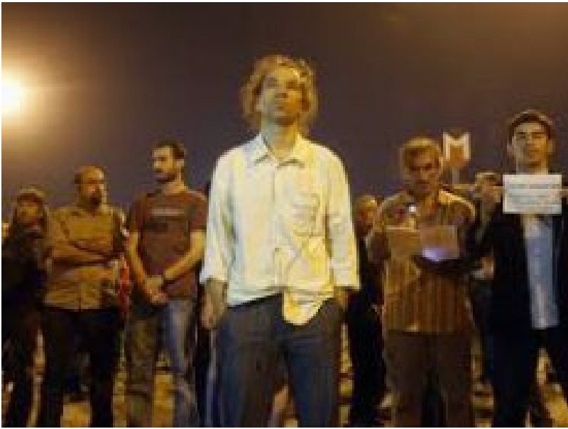
Erdem Gündüz, lo standing man (Istanbul, 2013).

Come nota nel suo intervento Nina Baldi, si crea un’opposizione tra “essere Everybody” e “diventare Everybody”, tra una dimensione statica (molare e maggioritaria) e una dimensione dinamica (molecolare e minoritaria). Meglio, questa è una dinamica che nasce dal “farsi minoranza” e dal riconoscersi e rappresentarsi come tale. In quest’ottica, il Qualunque, il “tout le monde”, incarna una soggettività de-individualizzata che trascende i singoli soggetti nelle loro determinazioni storiche e sociali. Al tempo stesso, rappresenta anche una forma di resistenza agli assetti di potere.