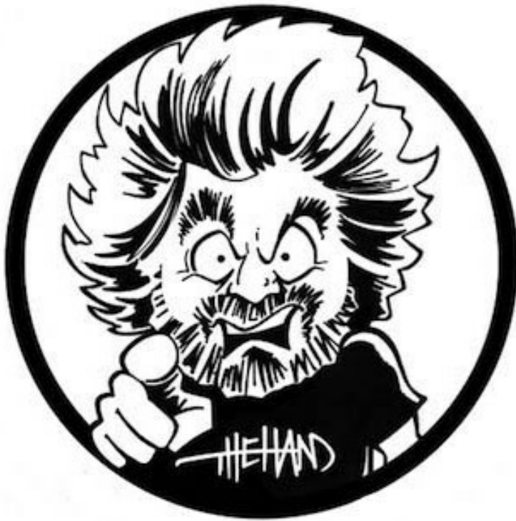
Beppe Grillo dito