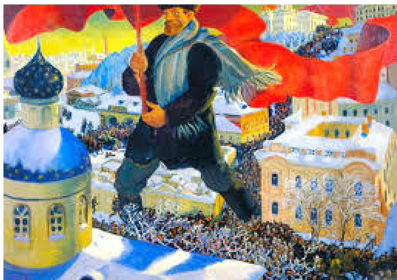
Boris Kustodiev, Il Bolscevico (1920).

Le diverse declinazioni iconiche dello Everybody, con le loro ambiguità, possono illuminare anche il suo percorso storico e il suo ruolo politico. Da quattro secoli, questa figura si trova all'incrocio tra tradizioni di lunga durata e rotture storiche e ridefinizioni.