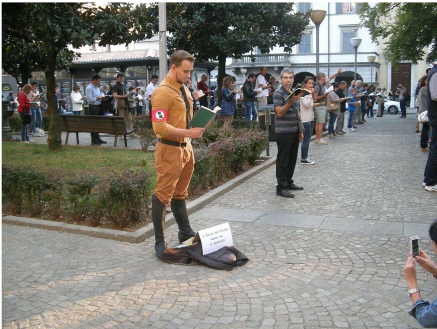
Le “sentinelle in piedi” (Bergamo, 2015).

Poco dopo la stessa forma di protesta è stata adottata in Italia in una chiave integralista dalle “sentinelle in piedi”, contrarie alle unioni omosessuali. L’iniziativa ha ispirato la provocazione del manifestante che a Bergamo nel maggio 2015 si è unito alle “sentinelle in piedi” che indossava una divisa nazista, al braccio la fascia dei “nazisti dell’Illinois” del film The Blues Brothers (1980) mentre leggeva silenzioso Mein Kampf (di fronte a questa immagine il pensiero va inevitabilmente alla “banalità del male” e agli Uomini Qualunque come Adolf Eichmann che furono gli artefici della Shoah).