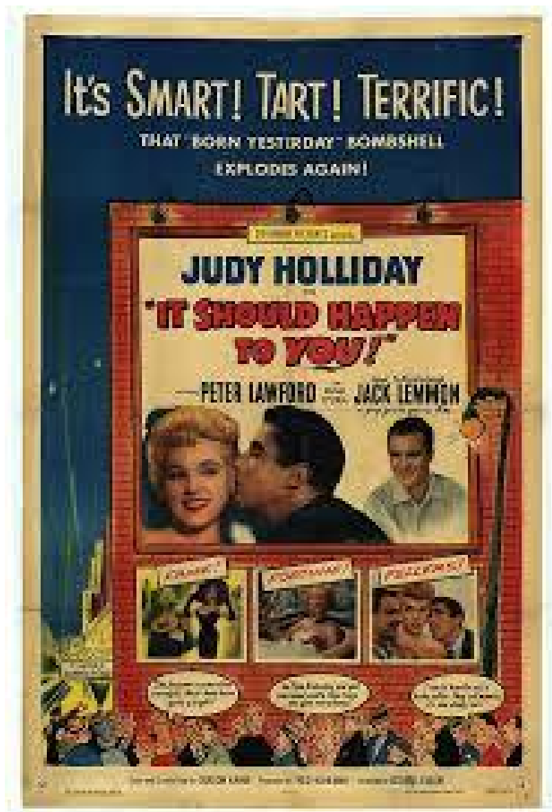
It Should Happen to You (1954).

È Gladys Glover, la protagonista del film di George Cukor La ragazza del secolo ( It Should Happen to You , 1954, sceneggiatura di Garson Kanin). Arrivata a New York con l'ossessione di diventare famosa, la giovane Gladys (Judy Holliday) investe tutti i suoi risparmi di commessa in un grande magazzino per mettere il suo nome su un cartellone pubblicitario: suscita l'interesse dei media, viene intervistata da giornali e radio, otterrà contratti pubblicitari, diventerà famosa e troverà persino l'amore.