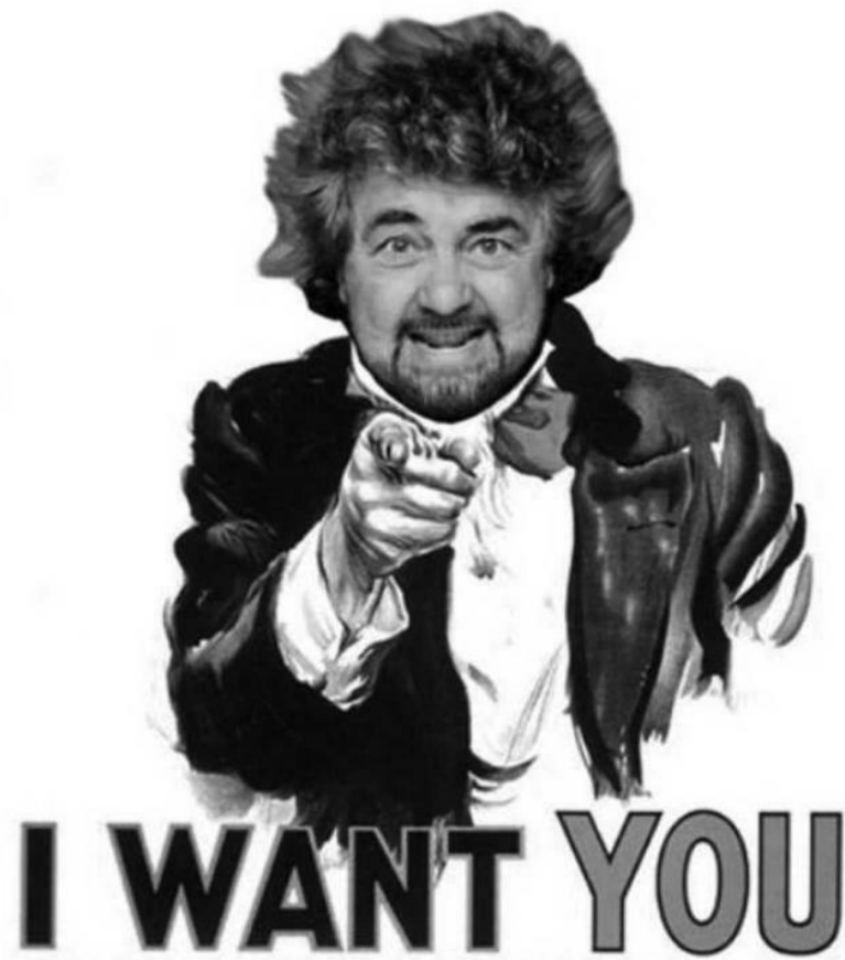
I want you.