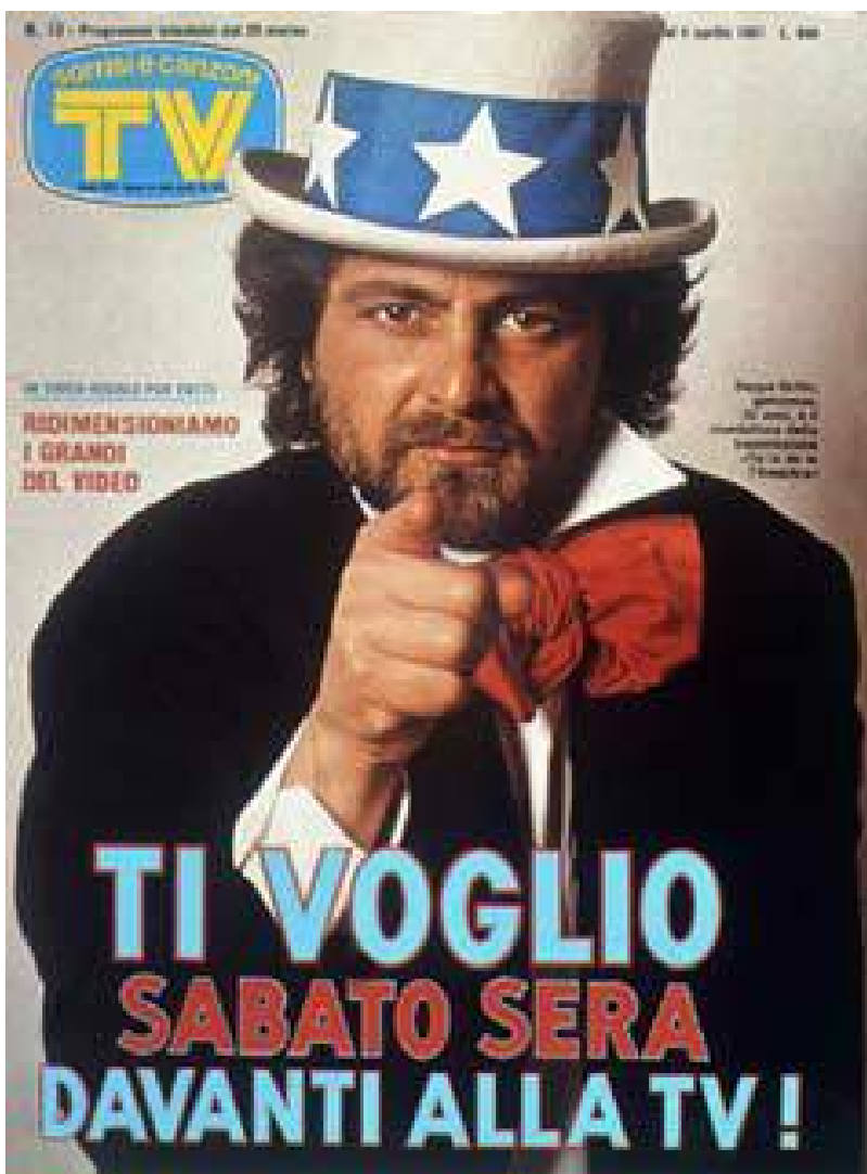
"Sorrisi e Canzoni TV", 1981.

In quest'ottica, con tutte le sue ambiguità, la parabola del Movimento 5 Stelle in Italia può essere utile per delineare alcune linee di tendenza (e ambiguità) della figura dell'Uomo Qualunque nel nuovo scenario della società digitale.