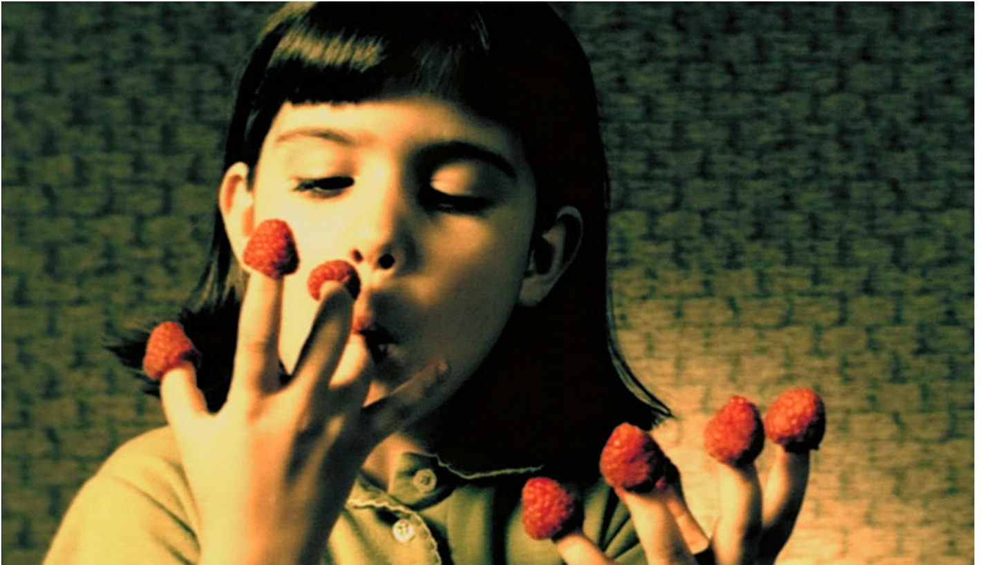
Il favoloso mondo di Amélie (2001).

pedone, si muovono infatti in zone incontrollate e incontrollabili dai meccanismi del potere, marginali e potenzialmente sovversive.