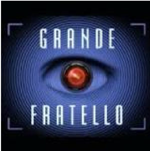
Il grande fratello.

La vicenda di Gladys anticipa di un decennio “il quarto d’ora di notorietà per tutti” profetizzato da Andy Warhol e più in generale alla spettacolarizzazione dell’Uomo Qualunque e della Ragazza della Porta Accanto che caratterizza la nuova scena mediatica: prima con i reality show , a partire dal Grande fratello (in onda in Italia dal 2000), dove si costruiscono celebrities effimere; poi con la spettacolarizzazione diffusa dei social media e degli youtubers, dove gli utenti diventano agenzia di pubblicità, comunicazione e marketing di sé stessi.