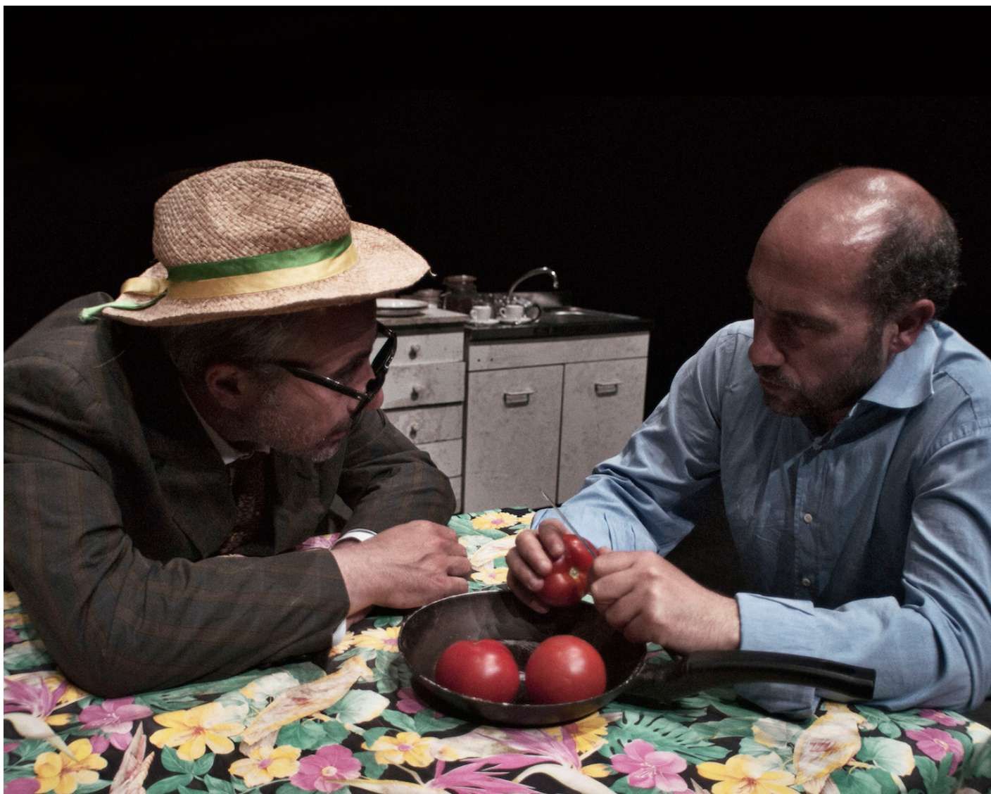
Nunzio, ph di Andrea Coclite.

Siamo in un pantano, di spettacolo in spettacolo travestito da losca stanza, da retrobottega, da cortile, da spianata aperta sui detriti, da cimitero, in un gioco, in una recita della replica che porta a situazioni simili all'effetto "palla di neve" che rotolando diventa valanga di cui parlava Bergson a proposito del comico. La loro ingenua tenacia, il loro stupore senza condizioni nello sbattere contro la realtà senza mai adattarsi, in fondo senza rinunciare ai propri piccoli-grandi sogni senza speranza su un orizzonte grigio, rimanda per sottrazione al piglio tragico, scatenatore di risate, di maestri della comicità come Buster Keaton o Laurel & Hardy.