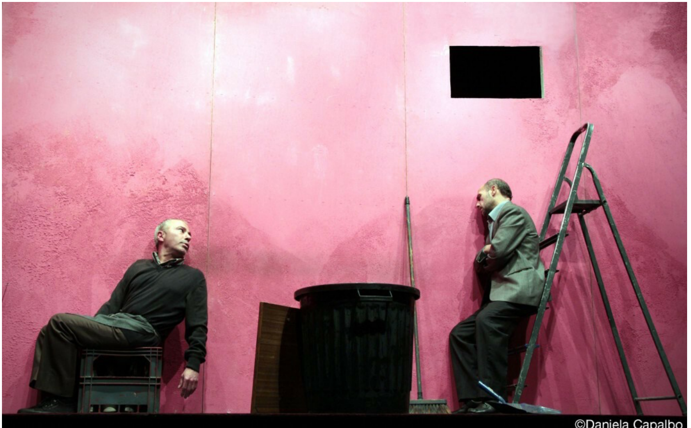
Bar