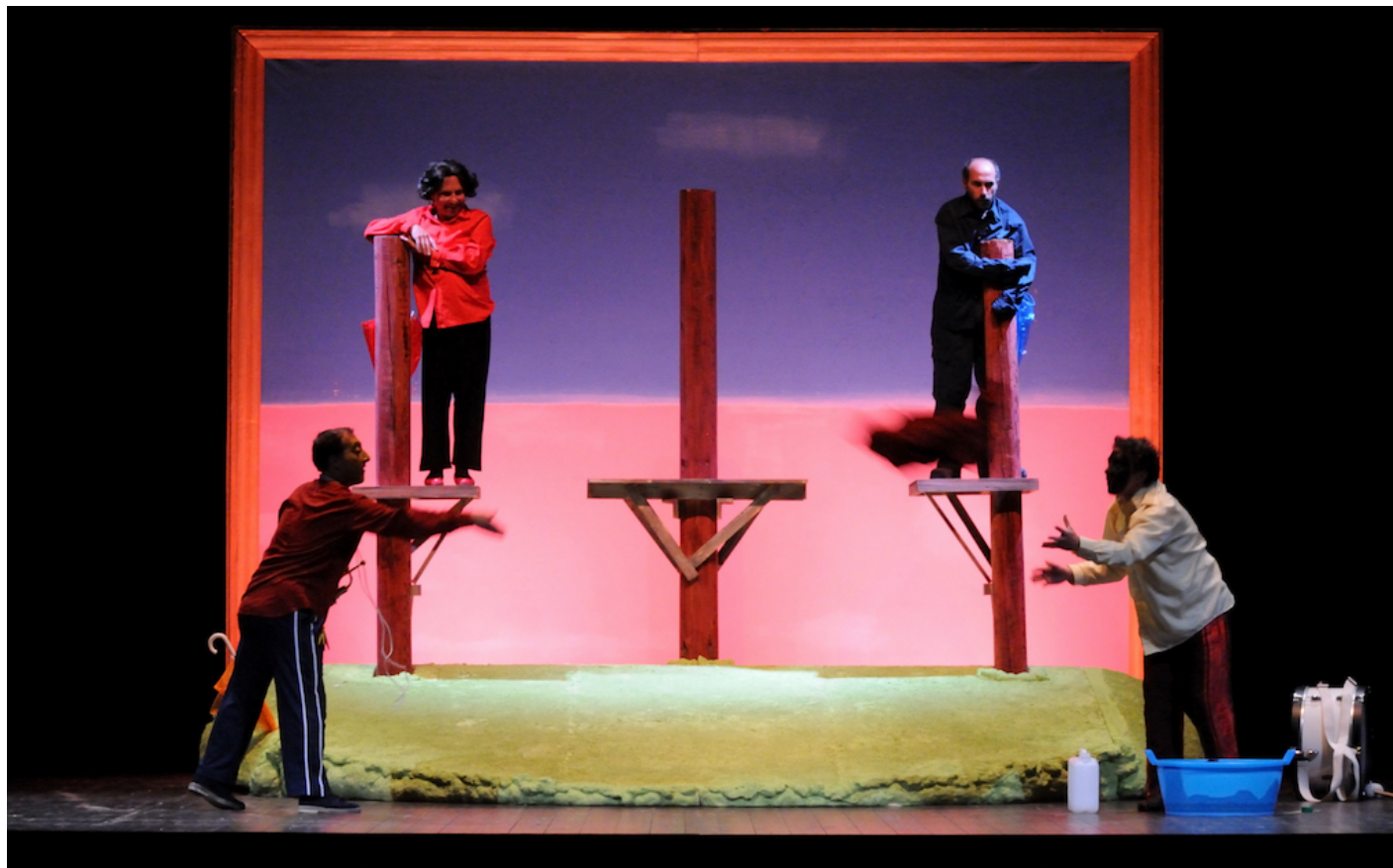
Pali, ph di Gianni Fiorito.

diventano letti: i vecchi prima, i pompieri dopo si stendono sotto coperte sul marmo degli avelli, mentre le frasi, i ricordi, i lapsus, le suspensioni, gli interstizi non solo del silenzio ma anche dell'articolazione di un discorso che sembra continuamente incagliarsi, senza futuro come i personaggi, tutto si ripete in loop che somigliano a quelli della banale vita ormai lontana, delle occasioni sprecate, sprofondando in un crepuscolo che diventa buio della morte. Illuminato dalle croci delle tombe che si accendono come notturni delicati abat-jour.