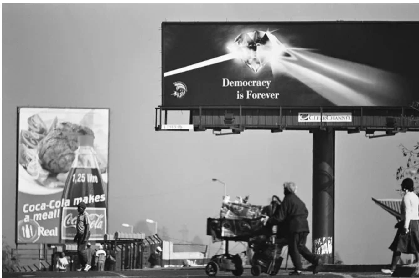
Democracy is Forever, Pimville / 2004 silverprint edition 5

Se continuiamo a tenere vivo questo spazio è grazie a te. Anche un solo euro per noi significa molto. Torna presto a leggerci e SOSTIENI DOPPIOZERO