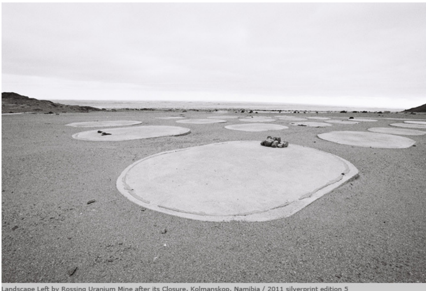
Landscape Left by Rossing Uranium Mine after its Closure, Kolmanskop, Namibia / 2011 silverprint edition 5

Si potrebbe dire con le parole di Georges Didi-Huberman, che il suo lavoro si configura come una “rappresentazione-processo”, in cui “l’automatismo della macchina fotografica rompe irrimediabilmente con ogni idea di rappresentazione-risultato (si osserva la natura, la si imita, il risultato è un bel quadro)”, sostituendola con il rimando a una molteplicità, nella quale l’immagine viene pensata come potenza e potenzialità di una serie, per cui si tende, non tanto a privilegiare il rapporto tra la singola immagine e la realtà rappresentata, ma la relazione delle fotografie tra loro, la sequenza. In questo modo la singola immagine sollecita la sovrapposizione e il riferimento ad altre immagini, che ne moltiplicano il senso, emancipandola dal semplice realismo della rappresentazione.