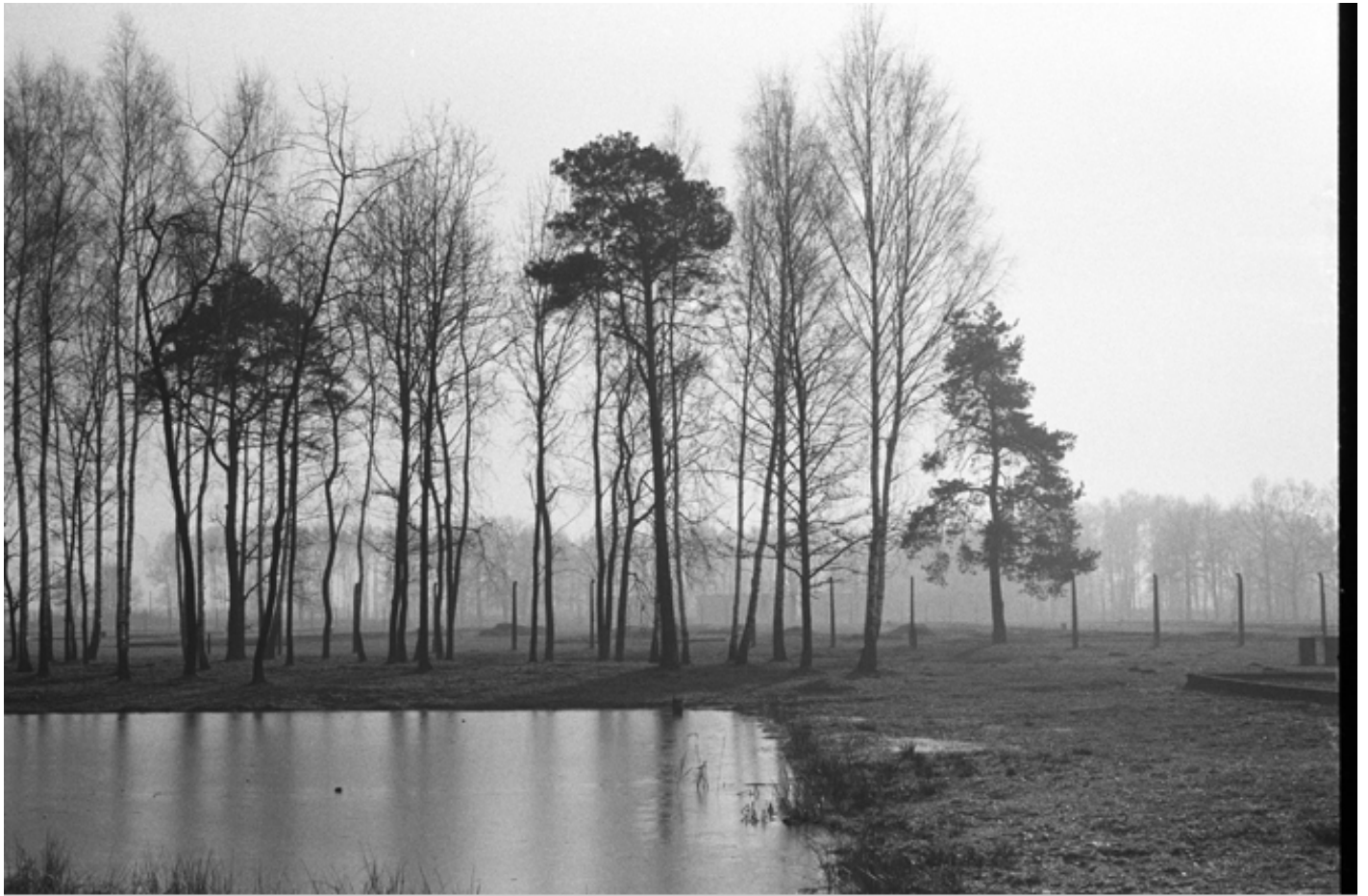
Lake Once Filled With The Ashes of tThe Cremated, KZ2-Auschwitz / 1997 silverprint edition 5

E lo stesso vale per le immagini di paesaggi avvelenati Poisoned Landscapes (2010-2011) e Climate change (2007): miniere dismesse, rifiuti tossici, effetti causati dai cambiamenti climatici, dove il fotografo cerca di mostrare ciò che di solito l'osservatore fatica a cogliere, raffigurando il soggetto con uno sguardo che esalta l'ambiguità sottesa alle immagini, tanto che in alcuni casi egli accosta desolazione e bellezza, come in Landscape Left by Rössing Uranium Mine , ideale risposta ai Trauma Landscapes .