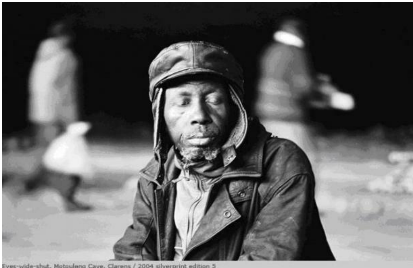
Eyes-wide-shut, Motouleng Cave, Clarens / 2004 silverprint edition 5

“Vieni” sembra dire l’immagine, “vieni ed entra nel mio mondo”. E questo accade. Tuttavia nelle fotografie di Mofokeng, la “descrizione” come direbbe Foucault, non è riproduzione ma decifrazione, nel senso che per ogni elemento presente nell’immagine, dopo la “de-scrizione”, è possibile “trovare uno spazio universale d’iscrizione”, in cui l’ultima parola non appartiene necessariamente al soggetto principale del discorso, ma coinvolge ogni individuo che osserva l’immagine, afferma Simon Njami. Un paesaggio ricorderà un altro luogo e poi un volto, un’ombra, la periferia di una città sudafricana o quella di una città asiatica.