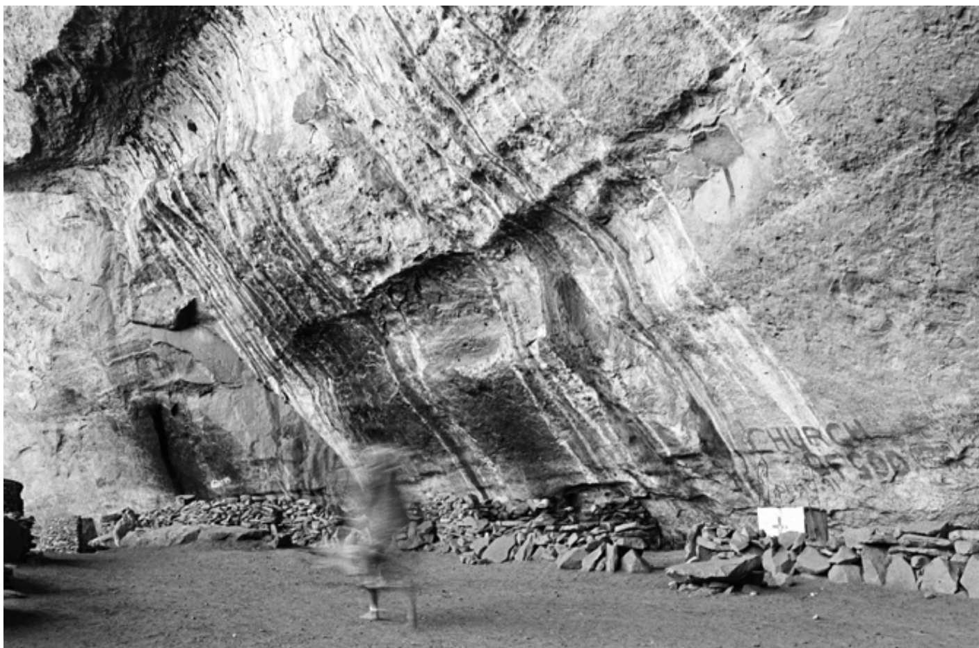
Church of God, Motouleng / 1996 silverprint edition 5

Nell’Africa del Sud, scrive Mofokeng, a differenza che nella tradizione europea, l’ombra indica qualcosa di reale. In sesotho , la sua lingua madre, la parola seriti corrisponde a ombra, ma l’assenza di luce non esaurisce il suo senso: seriti nel linguaggio quotidiano infatti può designare l’aura, la presenza, la fiducia in sé, la dignità, il potere di attirare la fortuna e allontanare la cattiva sorte e la malattia, come si può vedere in Rumours/The Bloemhof Portfolio (1988-1994).