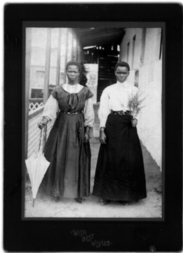
Slide 8/80 / 1997 black and white slide projection, installation edition 5