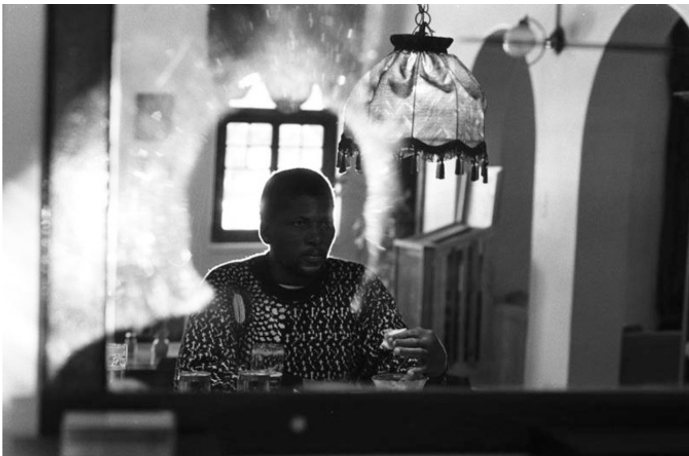
Moth'osele Maine, Bloemhof / 1994 silverprint edition 5

È in questa cornice che si inscrivono le peregrinazioni del fotografo, i suoi tentativi di dare corpo al paesaggio sudafricano, nei luoghi dove si è sedimentata l'ombra della violenza e della tragedia. L' ombra-seriti qui si fa "re-membrance", ovvero come dice Mofokeng, un processo grazie al quale diviene possibile ridare consistenza ai ricordi dimenticati. In questo caso il corpo è il paesaggio, sul quale si proiettano storie e miti che ricoprono un ruolo centrale nella costituzione dell'identità nazionale. In Vlakplaas (luogo di detenzione e morte tristemente famoso al tempo dell'apartheid) il paesaggio naturale viene deturpato solo dalla presenza di una rete metallica, indice e traccia di uno spazio carcerario, oltre che metaforica cicatrice nel paesaggio e nella memoria del suo paese, mentre nel trittico di immagini intitolate Robben Island , si vedono solo gli angoli del muro che separa lo spazio della reclusione da quello del mondo esterno.