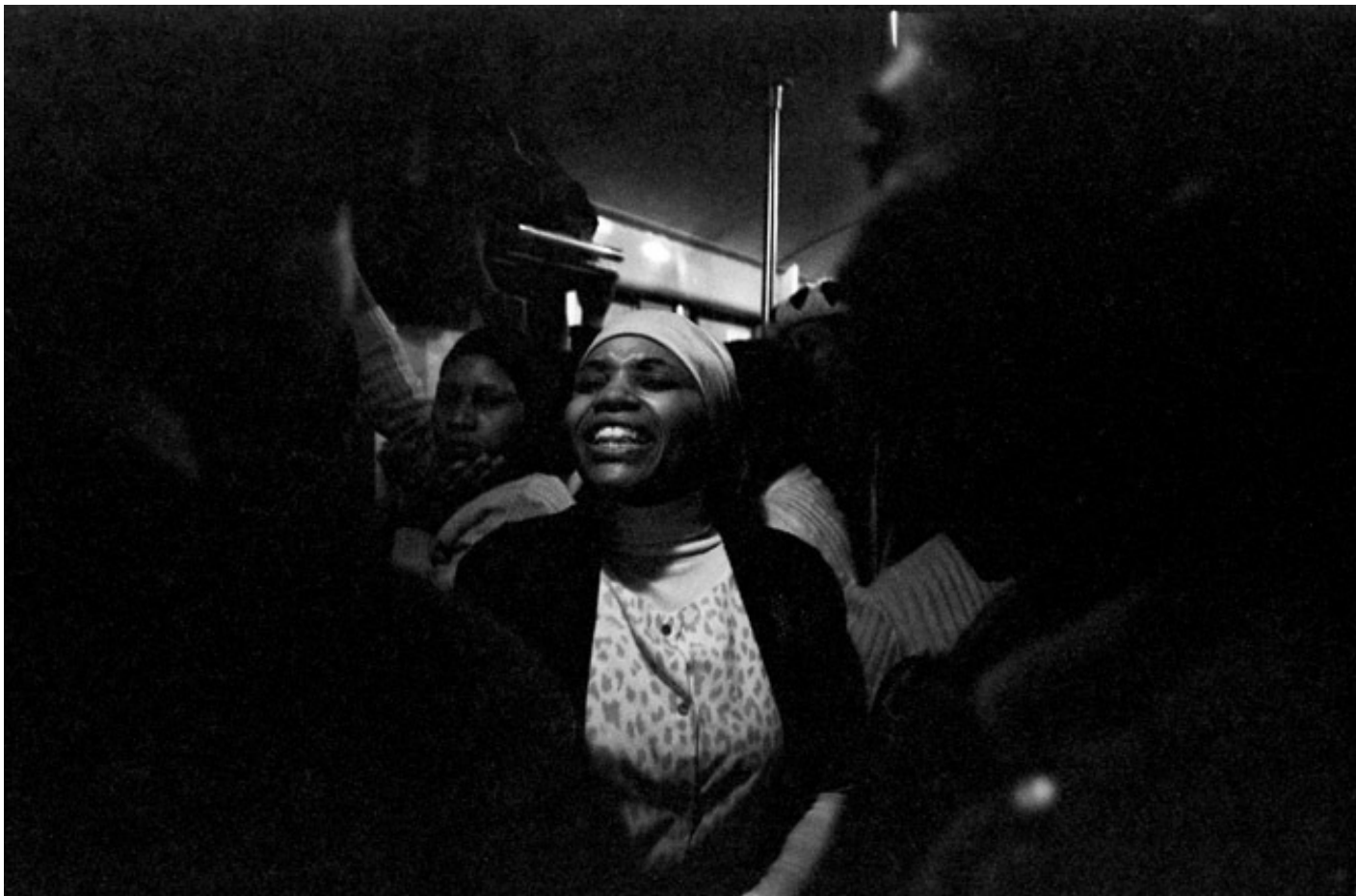
Exhortations, Johannesburg - Soweto Line / 1986 silverprint edition 5

O ancora come avviene in Chasing Shadows (1996-2004), dove il fotografo affronta da un altro punto di vista la questione della spiritualità. Realizzate nel corso di oltre un decennio, le fotografie sono state scattate nelle grotte di Motouleng, Manspopa e nei diversi luoghi di pellegrinaggio dislocati nella provincia del Free State, in Sudafrica, considerati sacri sia dalle comunità cristiane, sia dai seguaci delle religioni ancestrali. Le “shadows” sono le ombre, le anime, le presenze, gli spiriti, le energie che formano il mondo ed evocano allo stesso tempo qualcosa di chimerico e reale, dove sacro e profano, umano e divino, si fanno mondi labili. In Church of God la sacralità del luogo si confonde con “l’aura” dell’individuo, forze invisibili che lasciano tracce nel mondo tangibile.